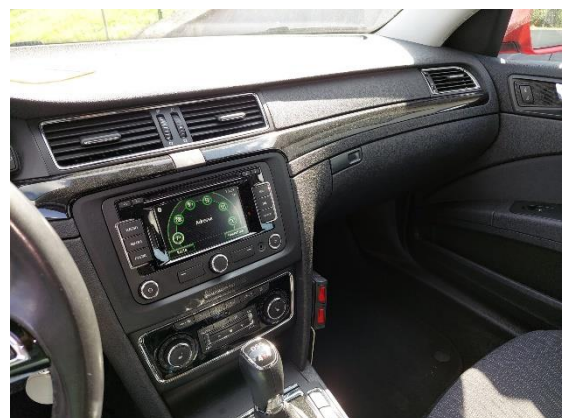
Skoda Superb 2,0 TDI – FW-12E