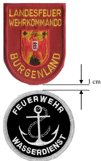
Abbildung 2 (Symbolfoto)